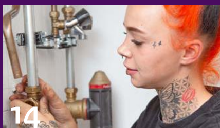
Vrouwen in de techniek